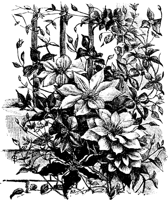
Clématites hybrides à grandes fleurs.

A moins d'instructions contraires, nous REMPLACERONS d'office, par des variétés similaires, celles qui se trouveraient épuisées au moment de l'exécution des commandes.