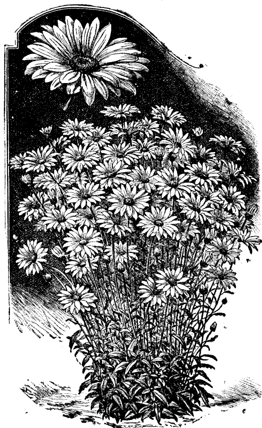
Chrysanthemum maximum de Vomero.

Fleur très double, blanc pur. Plante précieuse pour la fleur coupée. Fl. d'Avril à Juillet. — Haut. 40 à 60 cent.